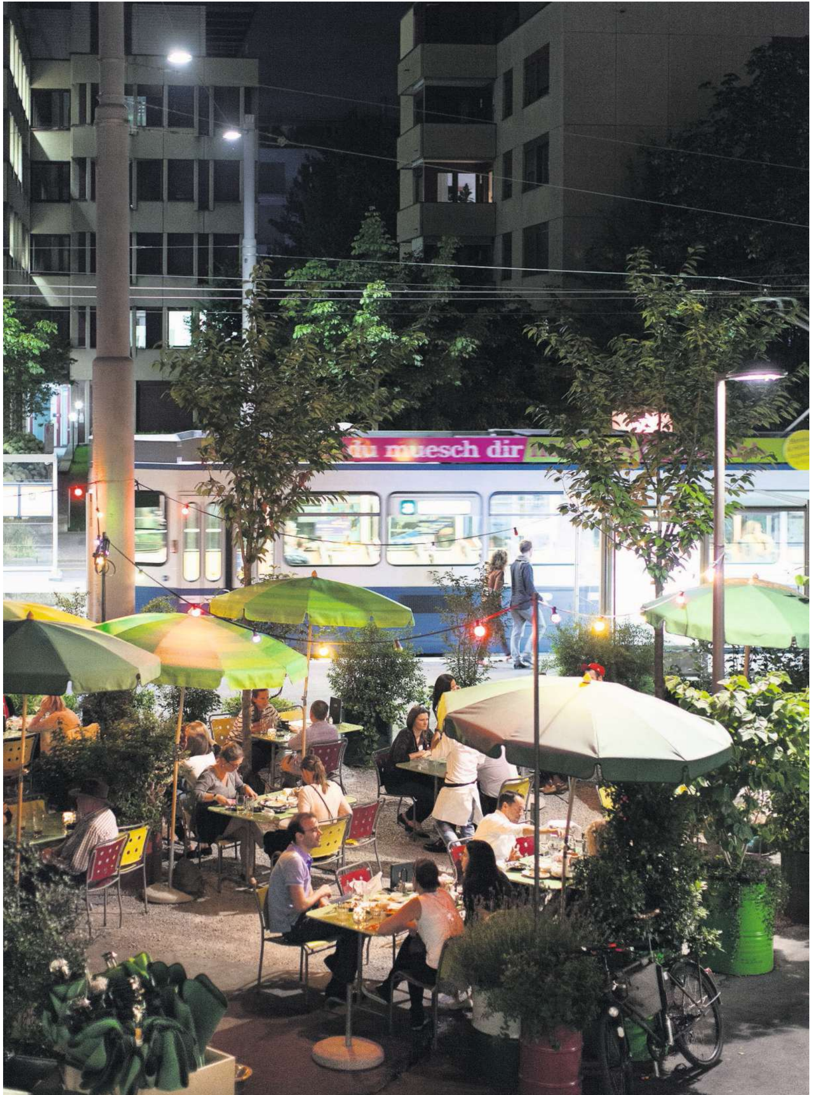
Aussenterrasse des «Bebek» in der Kalkbreite: orientalische Speisen aus lokalen Zutaten, innen unter Kronleuchtern. (Zürich, Ende Juni 2015)