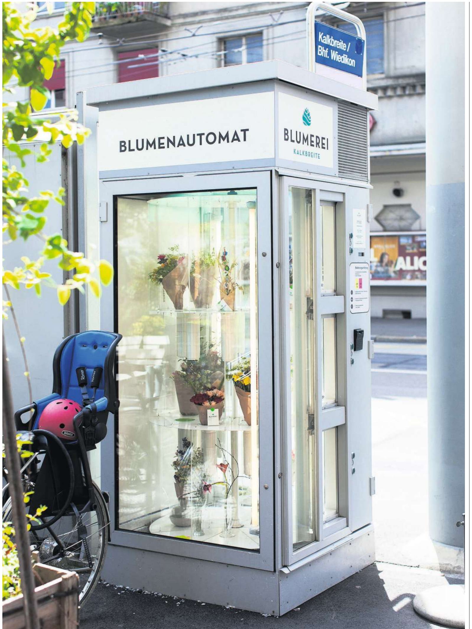
Schöne Redundanz: In der Kalkbreite gibt es vor allem Dinge wie den herzigen Blumenautomaten, den niemand braucht. (Zürich, Ende Juni 2015)